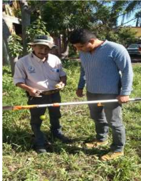
Figura 2. Acción de control focos de infestación de barrenadores de hueso en el Municipio de Quimixtlán.